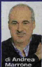
di Andrea Marrone

In libreria Un impietoso e divertente ritratto del popolo dei navigatori estivi